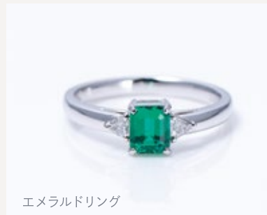
エメラルドリング